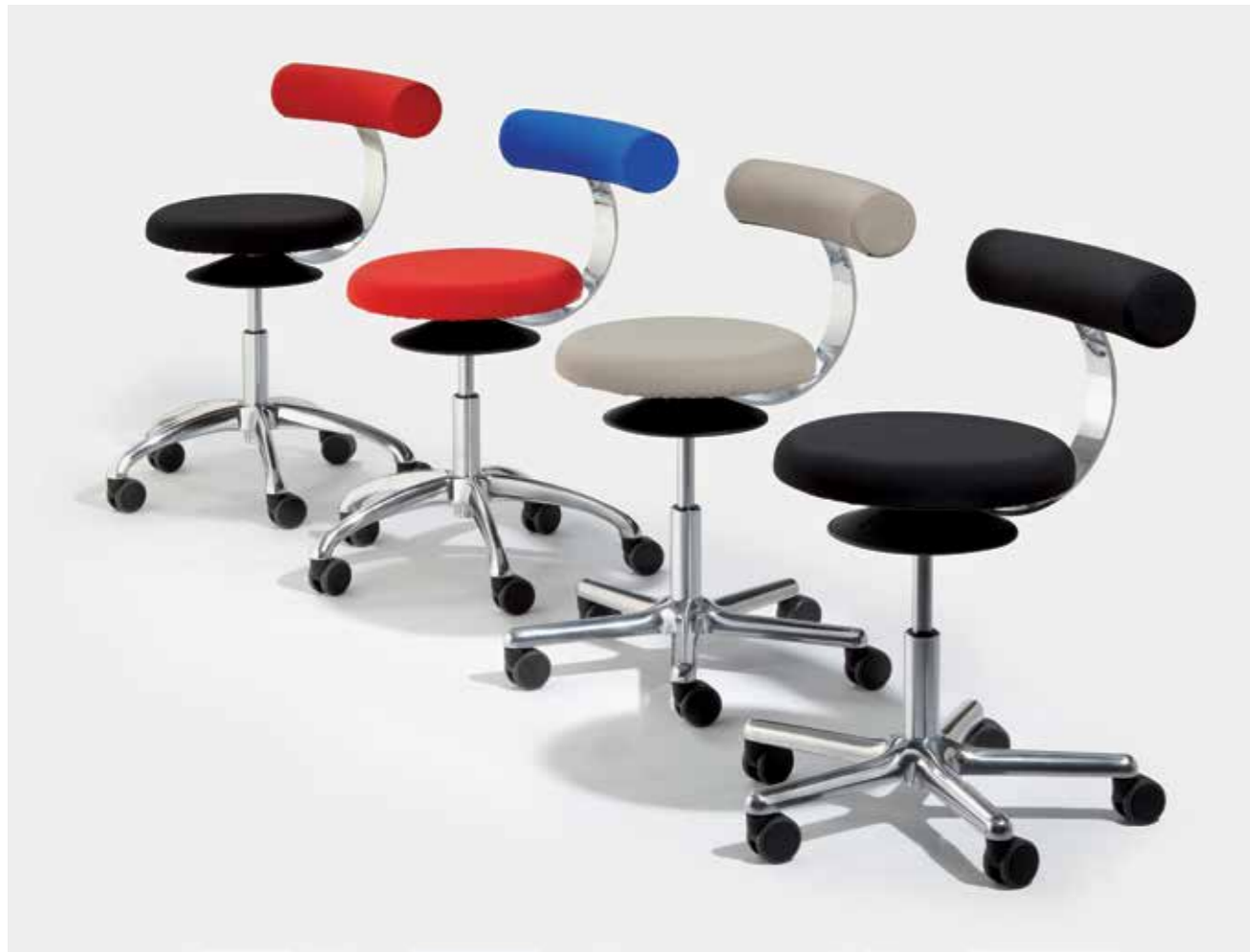
AOGO A und AOGO E