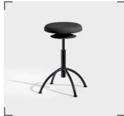
ERGO 3 V