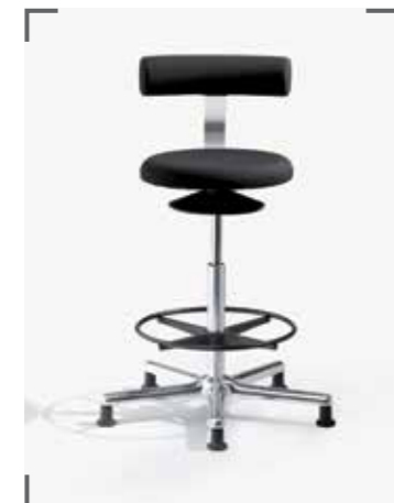
AOGO XL E