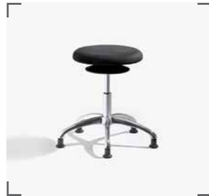
ERGO 3 A