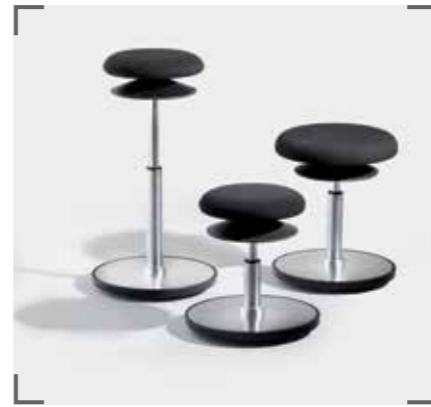
ERGO 1 und ERGO 2