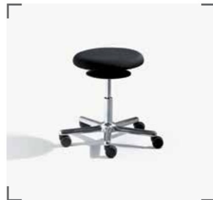
ERGO 3 E